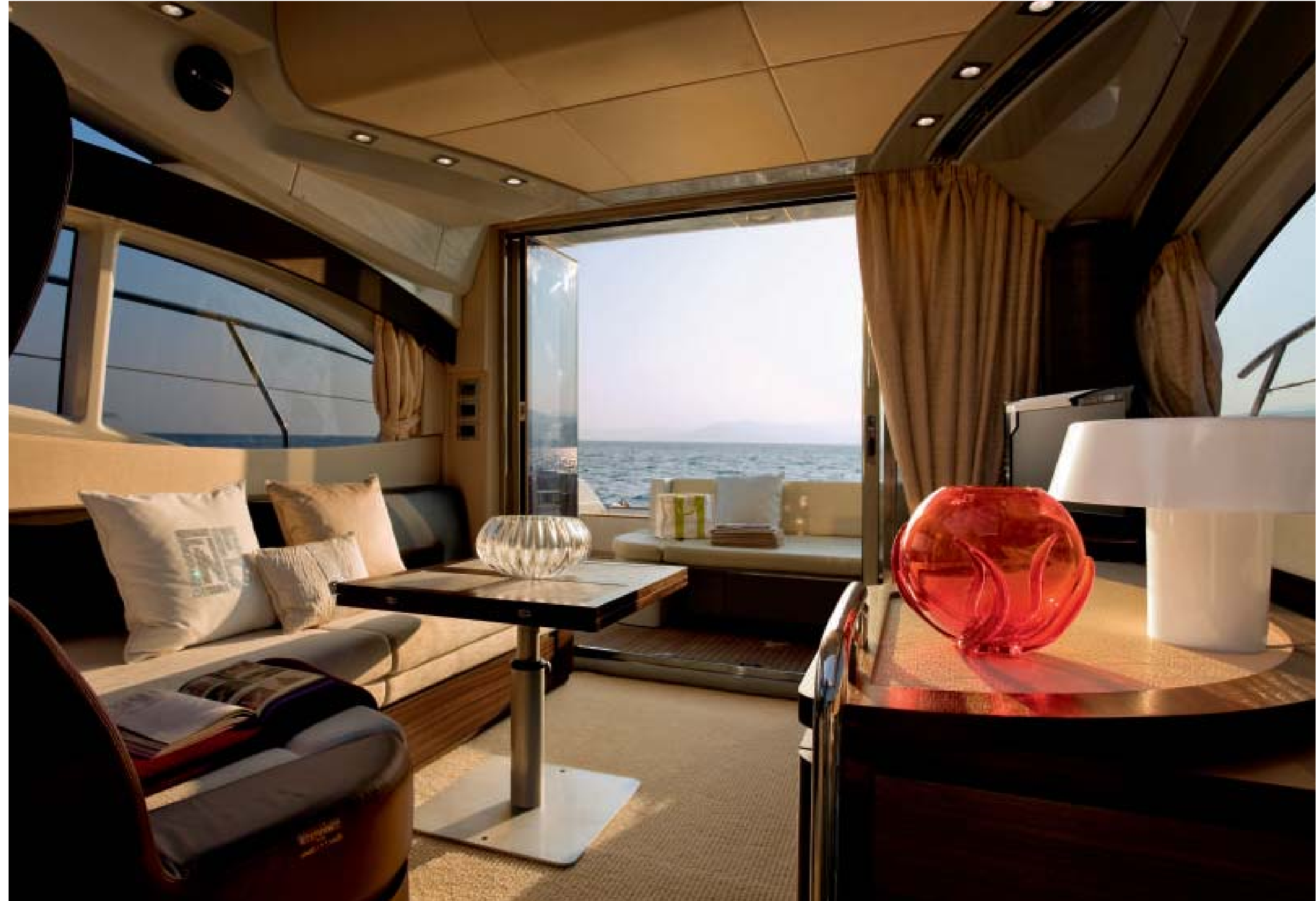
1. Timoneria interna 2. Cucina 3. Salone