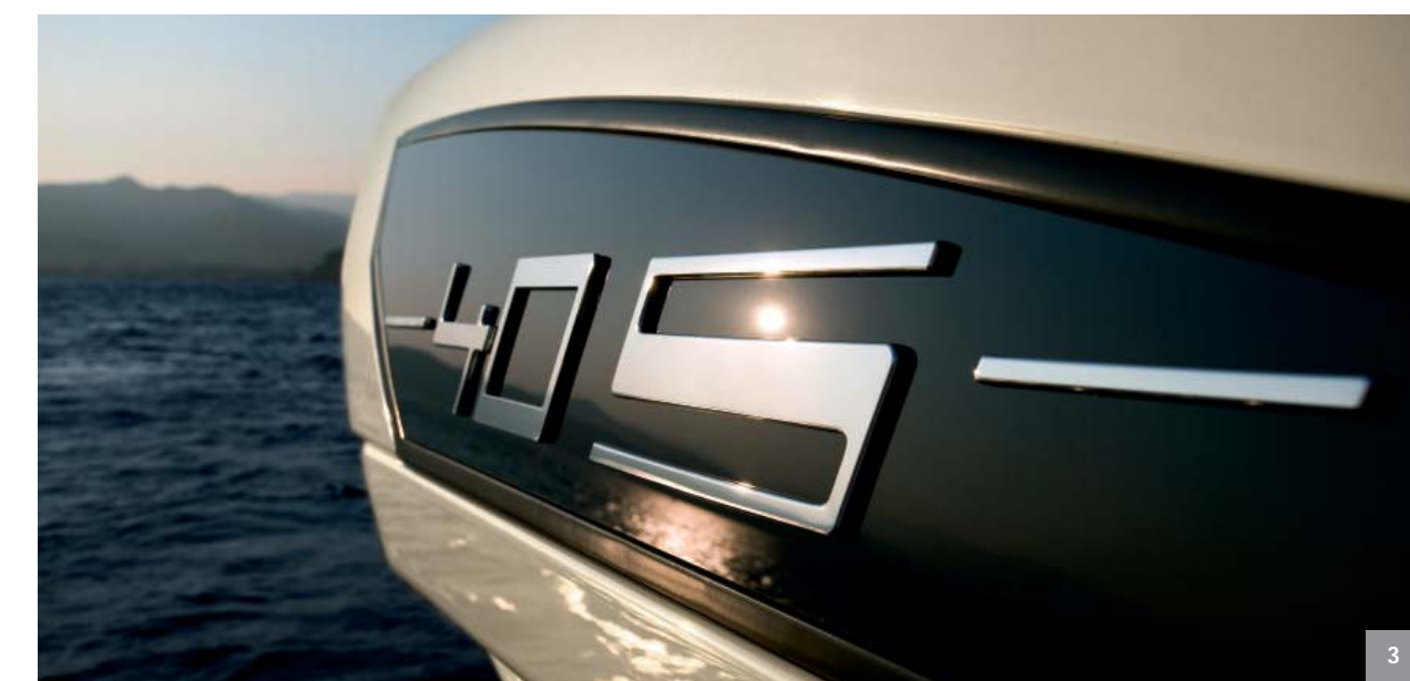
1. Area prendisole di prua 2. Pozzetto 3. Dettaglio esterno